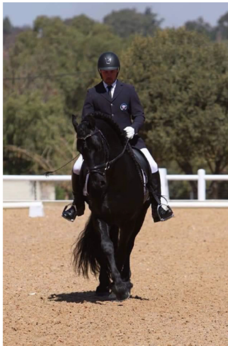
Links : Peatos van Pela Graca gery deur Phillip Jacobs in die Novice vlak!